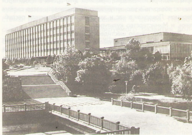
Административное здание аппарата Президента Республики Узбекистан

В результате был объявлен официально республиканский конкурс на этот комплекс под названием «Широкоформатный кинотеатр с залом многоцелевого назначения на 2500 мест» в г.Ташкенте. Ю.Халдеев и В.Березин возглавили наш коллектив, а когда мы выиграли этот конкурс, В.Березин, как самый опытный в нашей команде, возглавил рабочее проектирование.