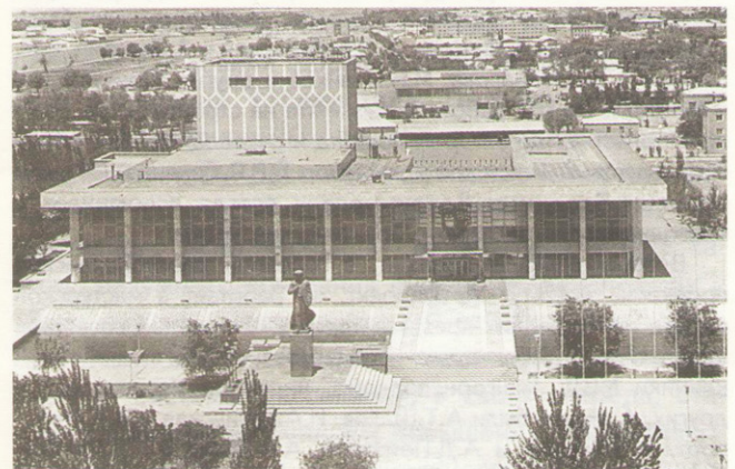
Музыкально-драматический театр в г. Нукусе