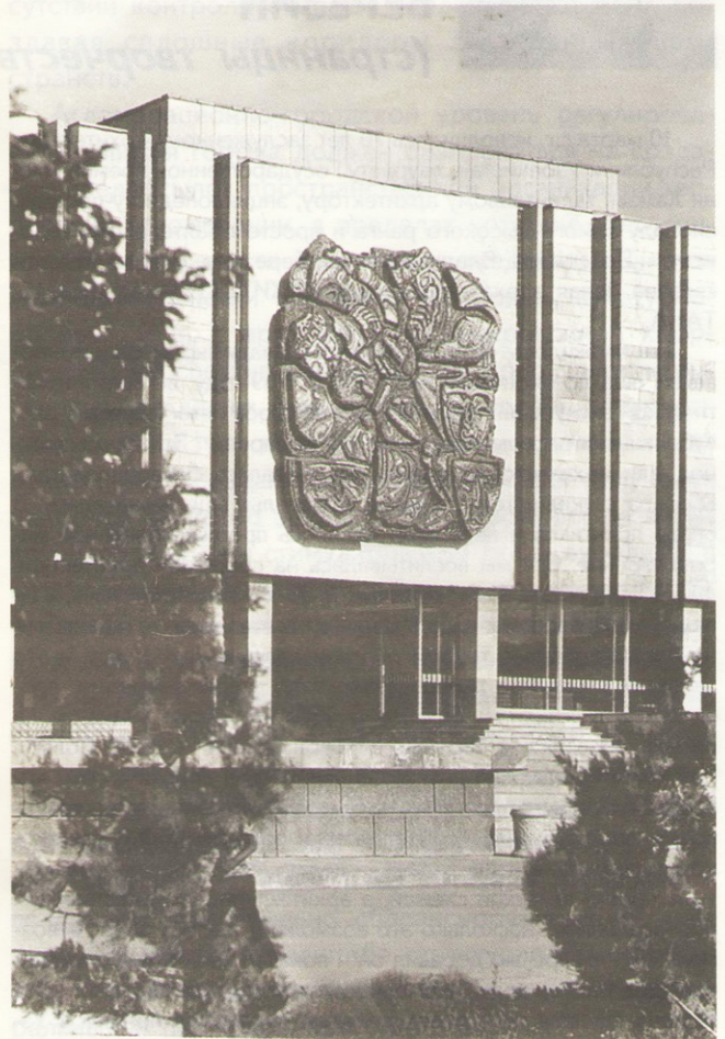
Музыкально-драматический театр в г. Ургенче

Параллельно с работой над Панорамным кинотеатром в